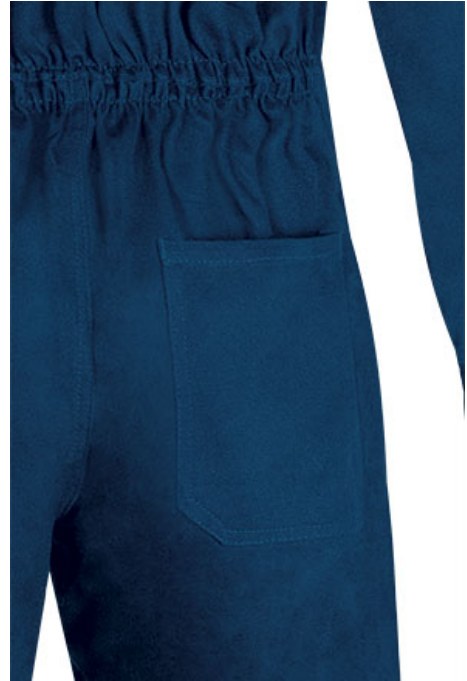
Detalhe bolso traseiro lado direito