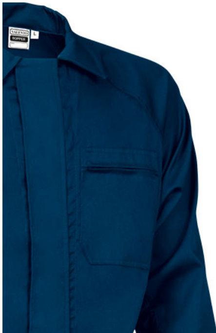
Detalhe do bolso no peito esquerdo