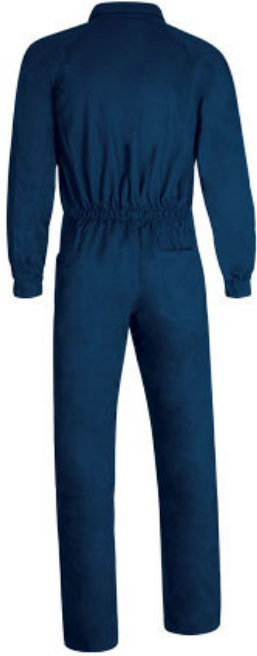
Vista parte traseira da peça